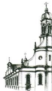
Kirche St. Joseph

In der Liturgie der hl. Osternacht werden wir schliesslich der glorreichen Auferstehung des Herrn freudig gedenken, die im sakramentalen Leben der Kirche zum Ursprung unseres neuen Lebens mit Christus geworden ist. Die Frauen kamen zum Grab