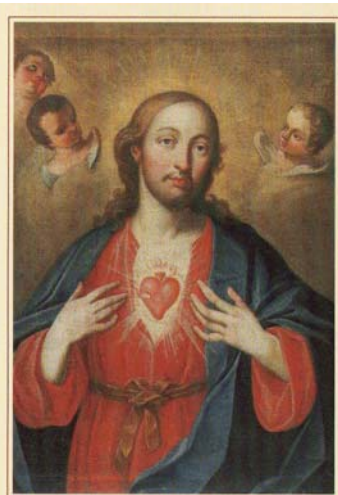
BILDE UNSER HERZ NACH DEINEM HERZEN!

Für die Werktagsmessen im Borromäum, Byfangweg 6, 4051 Basel wenden Sie sich bitte an H.H. Kanonikus Trauchessec (Natel 079 368 46 86)