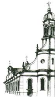
Kirche St. Joseph

Die Engel sind die unsichtbare Schöpfung, die wir im Glaubensbekenntnis bekennen. Diese unsichtbare Schöpfung ist nicht weniger reichhaltig als die sichtbare. In der Stufenordnung der Wirklichkeit stehen die Engel Gott am nächsten, weil sie nicht materiell gebunden, sondern reine Geistwesen sind. Der hl. Thomas von Aquin lehrt uns, daß jeder Engel seine eigene Gattung und seine eigene Art ist. Man könnte daher den Vergleich wagen, daß ein einziger Engel eine solche Seinsfülle besitzt wie die gesamte Ordnung des Lebendigen, den Menschen eingeschlossen. Es drückt sich also in diesem für uns nur noch schwerlich vorstellbaren Reichtum der Existenz der Engel in besonders beeindruckender Weise die Allmacht, Herrlichkeit und Großzügigkeit Gottes aus.